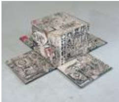
Tomoshige Kusuno Minúsculo e Maiúsculo, 1965; nanquim, grafite e óleo sobre caixa de madeira 52,5 cm x 160 cm x 160 cm 1972.3.1 Aquisição MAC USP