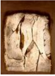
Tomoshige Kusuno Quadrado I, 1963; esmalte sintético e guache sobre papelão sobre madeira 79,6 cm x 60 cm x 3 cm 1963.7.4 Prêmio Aquisição I Jovem Desenho Nacional